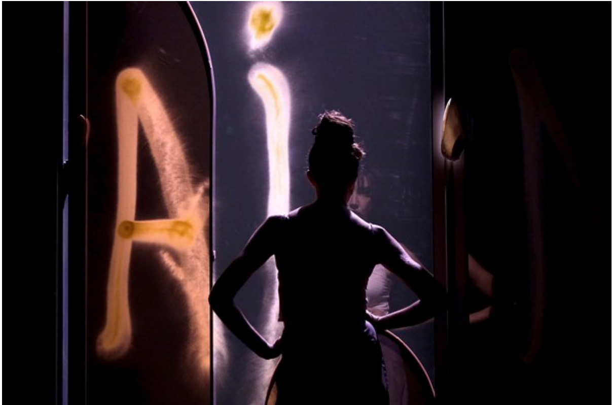
Mémoire de fille _Photo de répétition