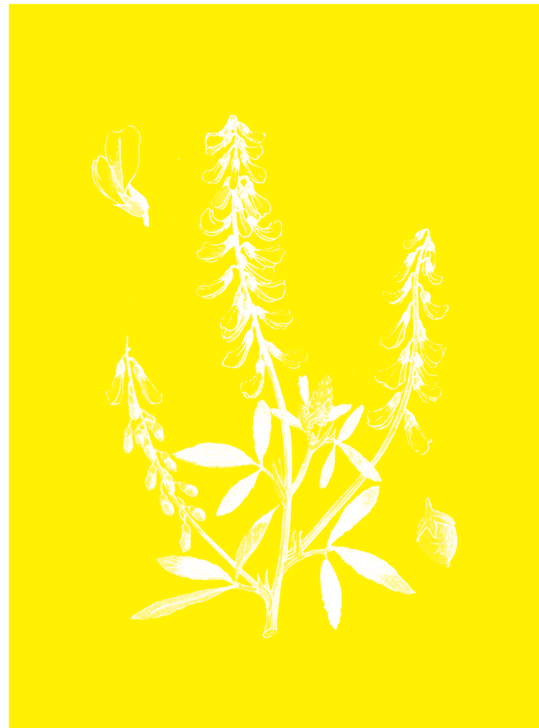
Métilot blanc Melilotus alba

Tour à tour corps-objet ou corps-agissant, ils déploient leurs circonvolutions, se confrontent à la matière organique, l'accompagnent, l'esquivent, s'y heurtent ou s'y fondent.