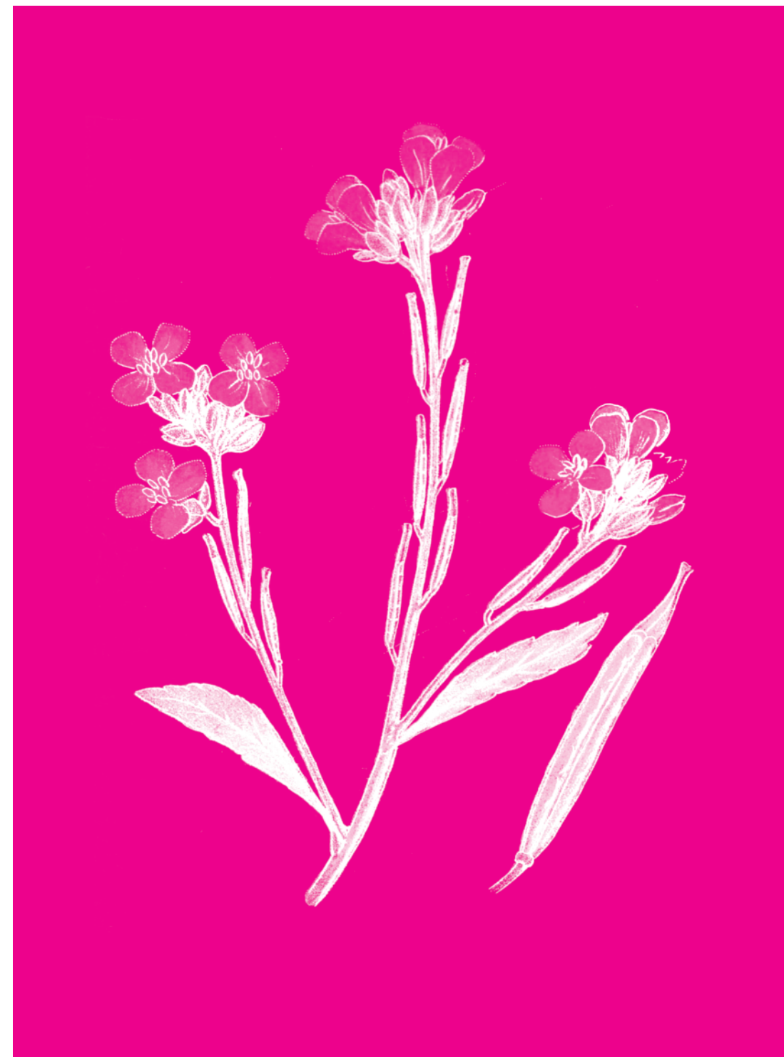
Moutarde noire Sinapis nigra

TOUTE LA SOIRÉE BAR ET RESTAURATION PAR L'ÉQUIPE TRAITEUR DE LA BULLE BLEUE