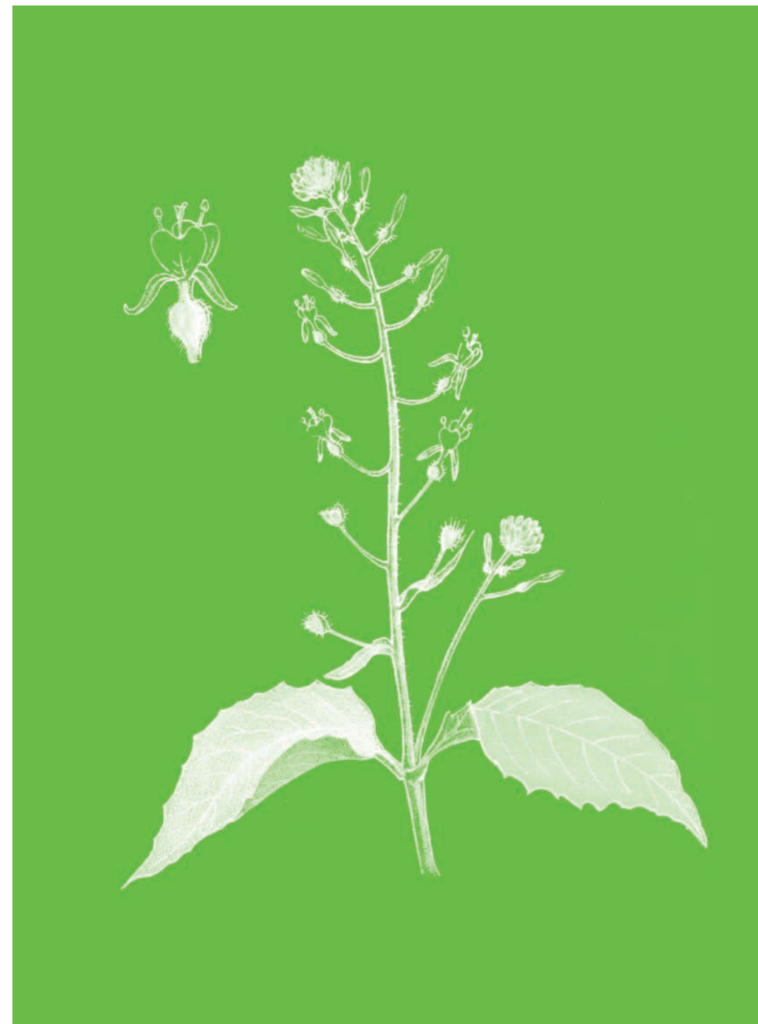
Circée de Paris Circaea Lutetiana

En dépit de son nom, qui rappelle celui de la célèbre magicienne qui transforma en pourceaux les compagnons d'Ulysse, la Circée ne possède bien entendu aucune vertu magique.