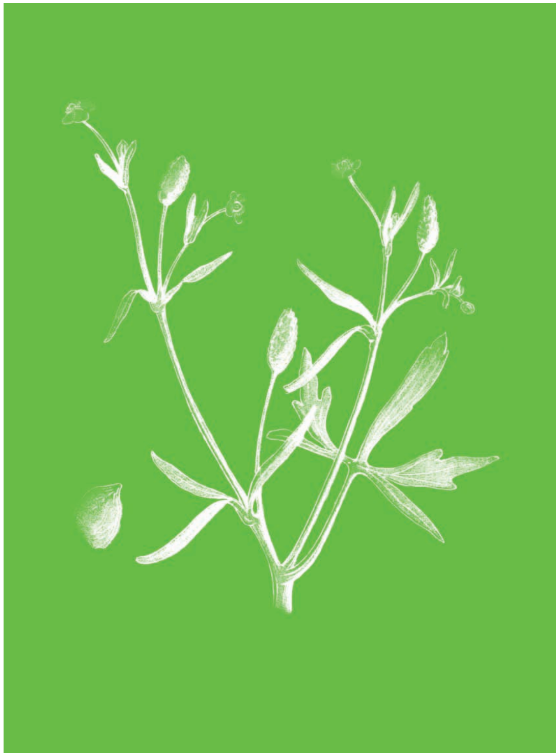
Renoncule scélérate Ranunculus sceleratus

On a dit que sa simple émanation amenait les larmes ; que ses qualités vénéneuses produisaient une contraction particulière des muscles de la face, que les anciens appelèrent rire sardonique . Nous avouons que nous n'avons jamais éprouvé les effets d'une plante qui ferait à la fois rire et pleurer.