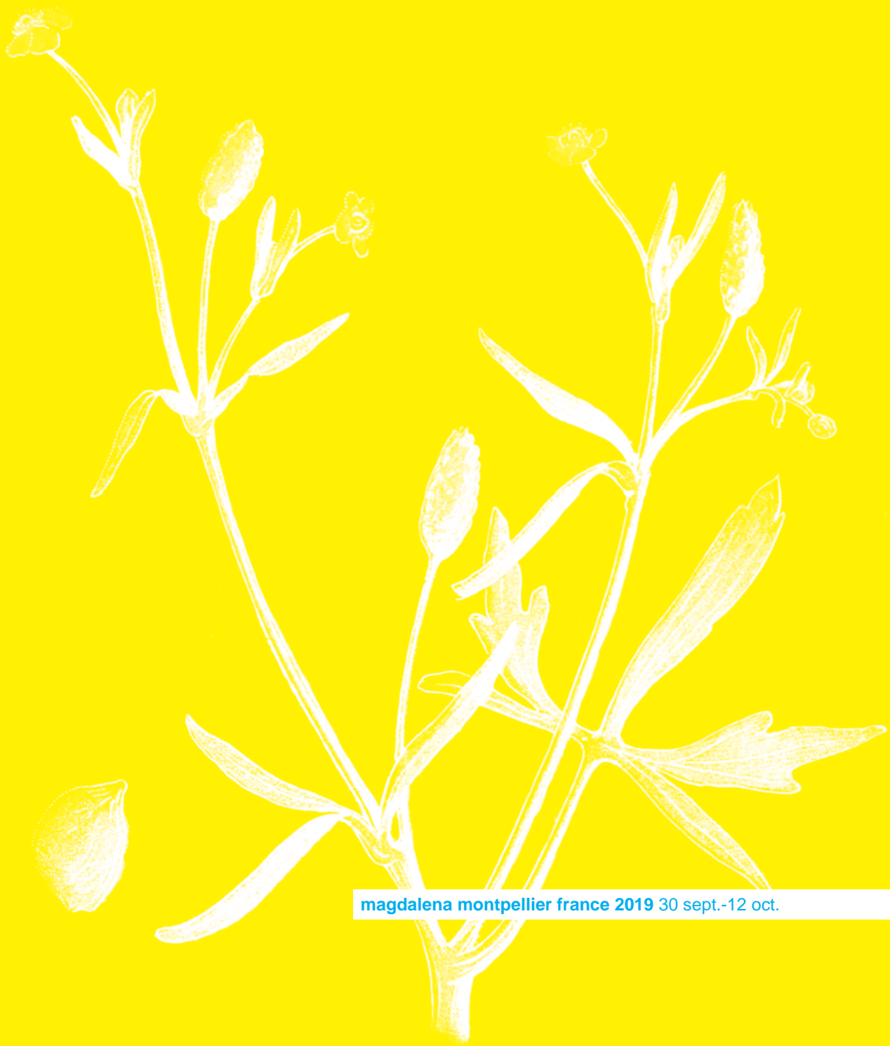
magdalena montpellier france 2019 30 sept.-12 oct.