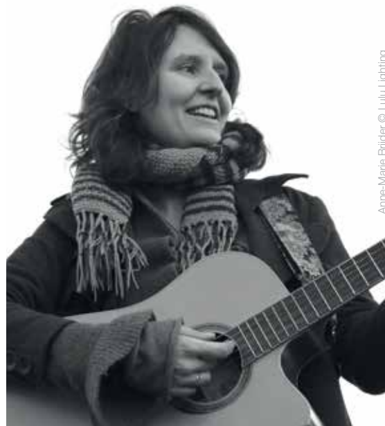
Anne-Marie Brijder